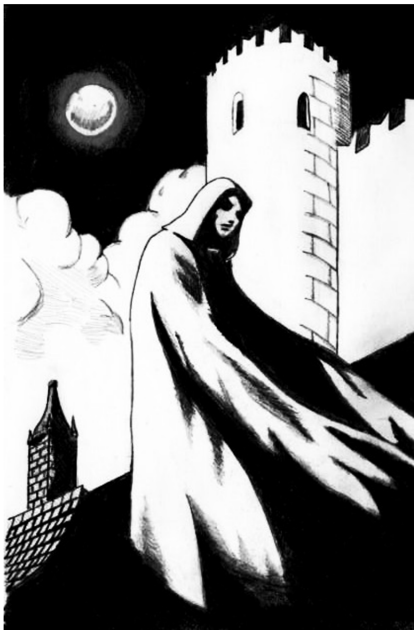
(fig. 1) vedi le ombre riunirsi e formare una sorta di cappa oscura dalla quale scorgi il volto di Luther

Decidi di non poter sostenere oltre questa situazione e cerchi di afferrarlo per fargli capire che non stai affatto scherzando, ma quando fai per muoverti ti rendi conto di essere completamente paralizzato, il mago deve aver utilizzato uno dei suoi malvagi incantesimi!